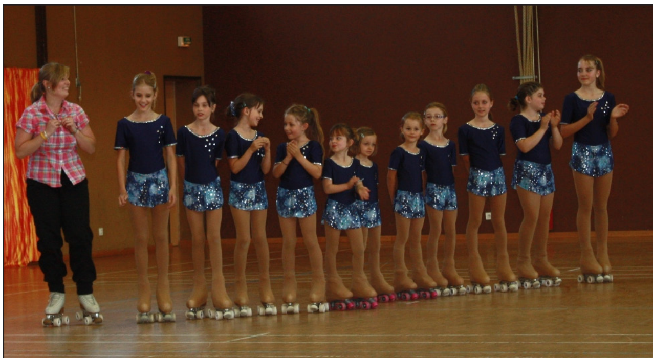
Die Rollsport-Gruppe im einheitlichen Aufzug.