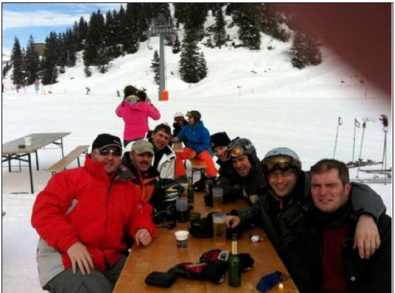
Die Senioren bei ihrem alljährlichen Skiweekend.

Die guten Resultate und der stetig wachsende Kader sind wohl nicht zu Letzt auch der Bewegung neben dem Fussballplatz zu verdanken. Und damit meine ich natürlich nicht die sich eifrig einlaufenden Ersatzspieler. Die Aktivitäten abseits des Fussballplatzes zeugen weiterhin von einem guten Teamgeist, dem Spass am geselligen Zusammensein und einem aktiven Vereinsleben. Der Titel unseres nächsten Ausflugs nach dem schon traditionellen Messebummel sagt hier schon alles: „Kuba – Zypern – Griechenland: D' Senne on Tour“. Zusammengefasst also: die Senioren – eine Abteilung in Bewegung!