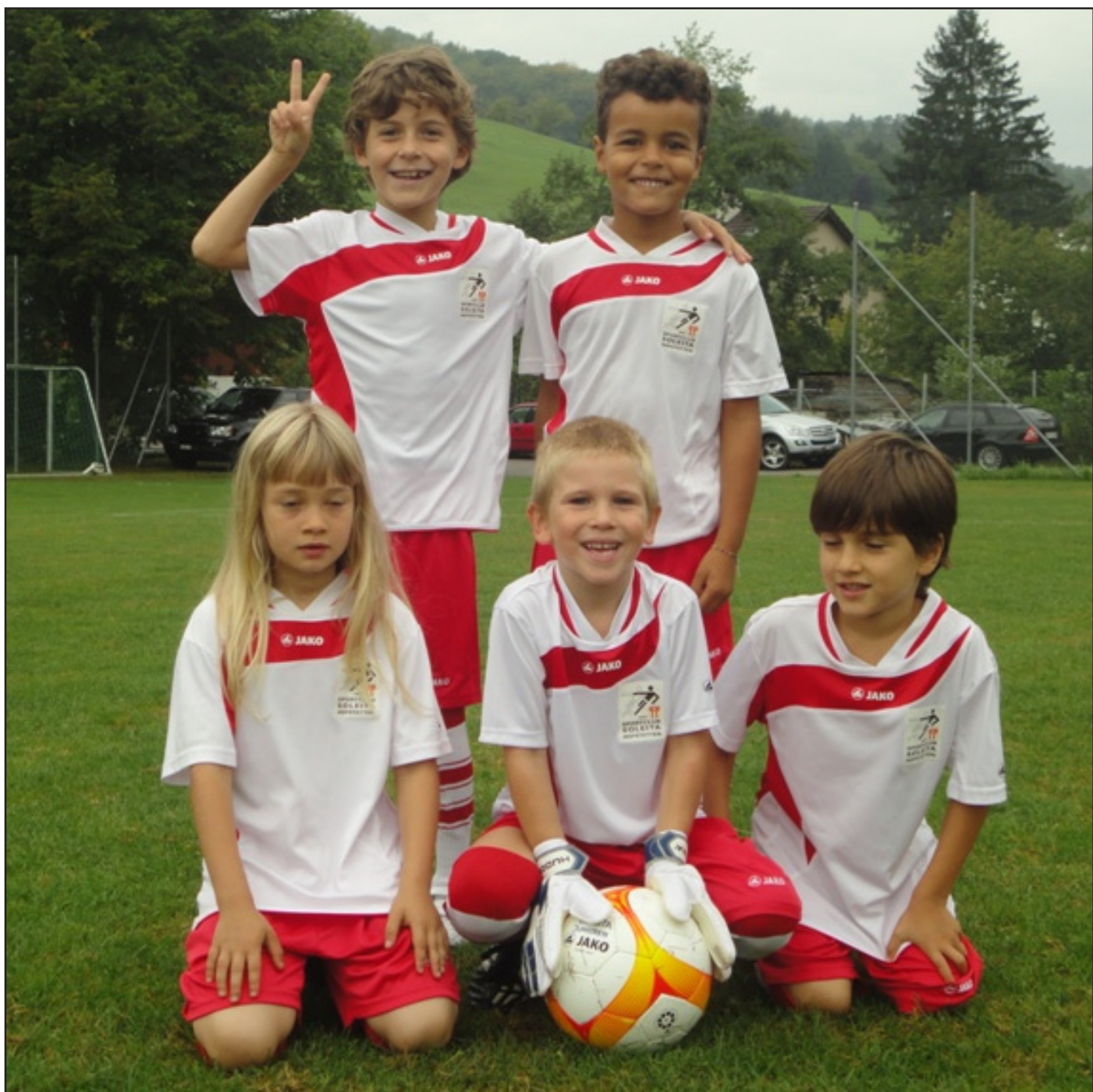
Die neuen Junioren G des SC Soleita Hofstetten.

Die Clubzeitschrift des Sportclub Soleita Hofstetten